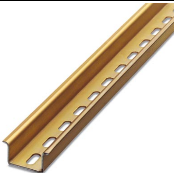
Hutprofil-Tragschiene, Material: Stahl, gelocht, Höhe 15 mm, Breite 35 mm, Länge: 2 m