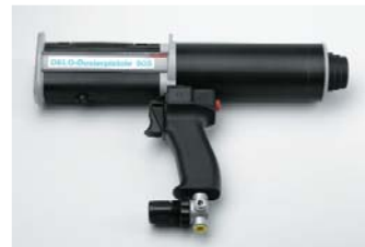
Dosierpistole 905 pneumatisch für 200 ml-Kartuschen