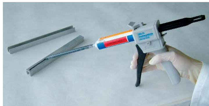
Einfache Mischung und Dosierung mittels DELO-AUTOMIX Dosierpistole 902