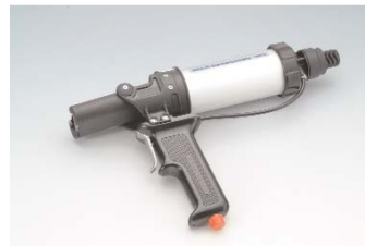
Dosierpistole 903 pneumatisch für 50 ml-Kartuschen