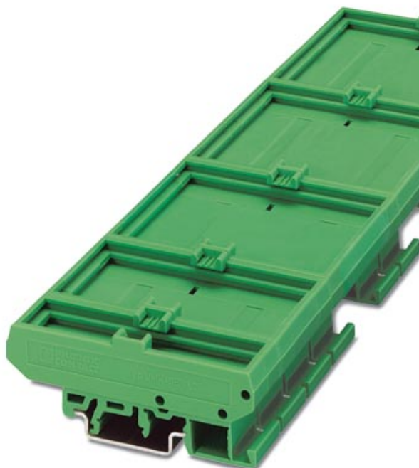
Abbildung zeigt eine Kombination aus den Varianten UMK SE 11,25, UMK BE 11,25,- 22,5, -45 und UMK-FE

Elektronik-Aufbauehäuse, Steckmodul-Basiselement